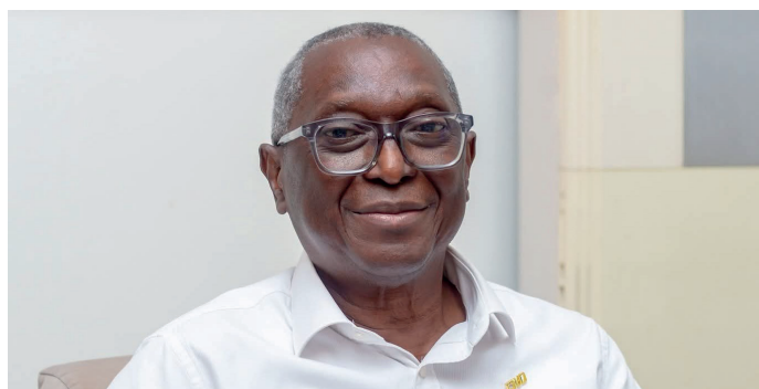
Photo et légende : Les métiers du cadre bâti scellent une alliance historique