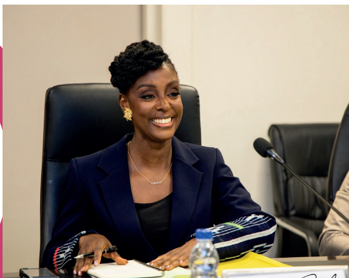
Photo et légende : CPRAIMA-CI joue un rôle clé dans la professionnalisation de la gestion locative